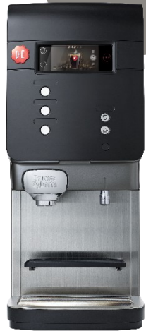
Quantum 100 Plus de café