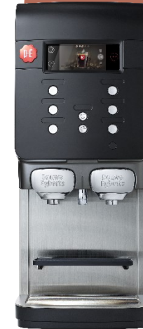
Quantum 300 Plus simultanément