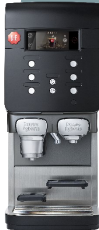
Quantum 200 Plus de variété

Sortie séparée pour les ingrédients moussés